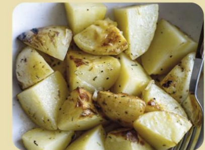
PATATAS AL HORNO CON ROMERO

Utilizar especias en la cocina nos ayuda a mejorar el sabor de nuestros platos además de favorecer la aceptación de alimentos que gustan menos en los más peques. Os animamos a utilizarlas en casa con las siguientes recetas: