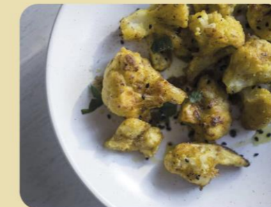
COLIFLOR ESPACIADA CON TOMILLO AL HORNO