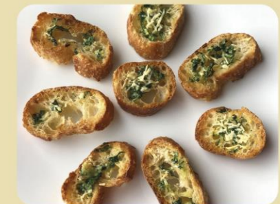
TOSTADITAS DE AJO Y QUESO CON PEREJIL