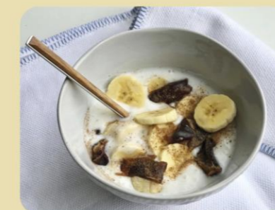
YOGUR CON DÁTILES, PLÁTANO Y CANELA